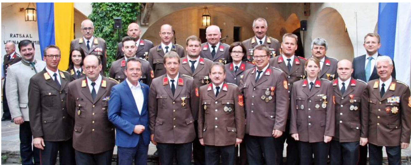
Verdienstmedaillen und Verdienstzeichen