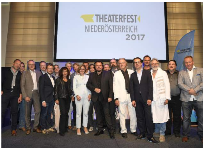
Gruppenfoto aller Intendanten/Innen der 20 Spielorte.

Acht von zehn Niederösterreichern und Niederösterreichern sagten, Niederösterreich sei ein Kulturland, betonte Landeshauptfrau Johanna Mikl-Leitner im Zuge der Programmpräsentation: „Das ist für mich Auftrag und vor allem auch Freude, diesen Weg weiter zu gehen.“ Eine besondere Bedeutung habe dabei die neue Kulturstrategie des Landes: „Kunst und Kultur sollen sich auch weiterhin in all ihren Facetten entfalten können. Wir wollen Kreativität und Talente fördern, und Kunst und Kultur sollen überall in Niederösterreich spürbar sein.“