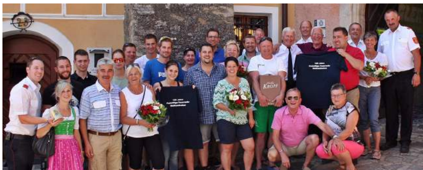
Partnerfeuerwehr Steinach/Stmk. die zahlreich zum Fest der Feuerwehr Weißenkirchen erschienen sind.

Die Feuerwehren Wösendorf, Joching, Weißenkirchen und Dürnstein konnten im Siedlungsteil - Auf der Burg - eine erfolgreiche Übung durchführen. Das Ziel der reibungslosen Zusammenarbeit konnte dabei eindrucksvoll erreicht werden. Vielen Dank an die Feuerwehrleute für eure Leistungen für uns alle. Ihr Bürgermeister