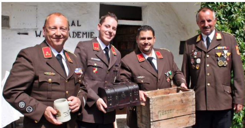
Geschenkübergabe von der Partnerfeuerwehr Steinach/Stmk. im Zuge der 150 Jahres Feier der Feuerwehr Weißenkirchen.

Kontakt Feuerwehrjugend: weissenkir- chen@feuerwehr.gv.at oder 0664/ 45 35 057 (Jugendbetreuer Florian Stierschneider)