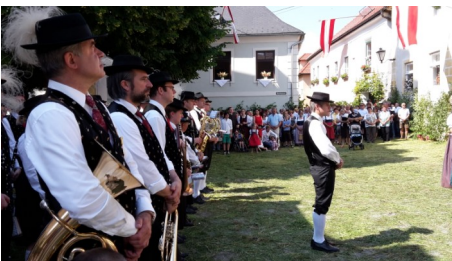
Fronleichnam am 7. Juni 2015 in Wösendorf.

Ebenso waren Sonnwendfeier, Fronleichnam und der Sicherheitstag mit Angelobung der Garde großartige Ereignisse, bei denen man sah, was eine Gemeinschaft, die zusammenarbeitet, Positives vollbringen kann.