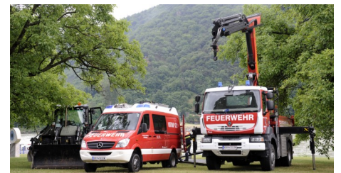
Ein Bagger des PiB3 sowie zwei unserer Feuerwehrfahrzeuge.

Danke allen die am Gelingen dieser Veranstaltung Beitrag geleistet haben. Besonders bei unserem Bauhofteam, dem Team in der Gemeindeverwaltung, den Feuerwehren sowie dem SCW und dem Tourismusverein für ihre Unterstützung!