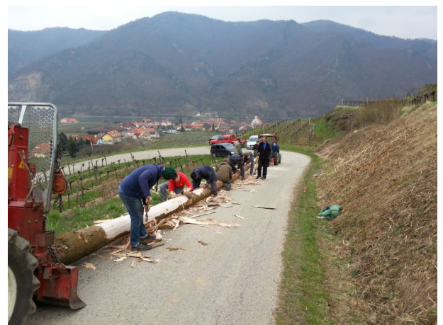
Der Feuerwehr Wösendorf danken wir sehr herzlich für unseren Maibaum.