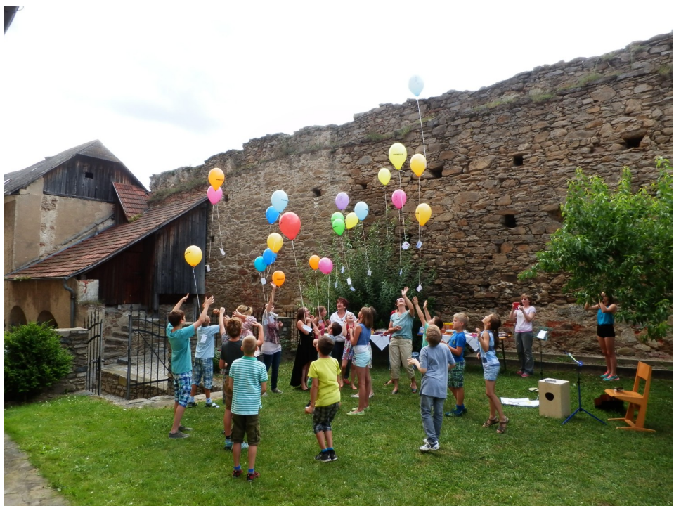
Wir wünschen unseren Schulabgängern weiterhin viel Erfolg.

Mit Begeisterung wurden am Vormittag alle Arbeiten für die Feier von den Kindern selbst erledigt: einkaufen, Aufstriche machen, Tische aufstellen und dekorieren. Das Büffet wurde abgerundet durch zahlreiche köstliche Mehlspeisen der Eltern. Dieses stimmungsvolle Fest bildete einen würdigen Ausklang einer ereignisreichen Volksschulzeit.