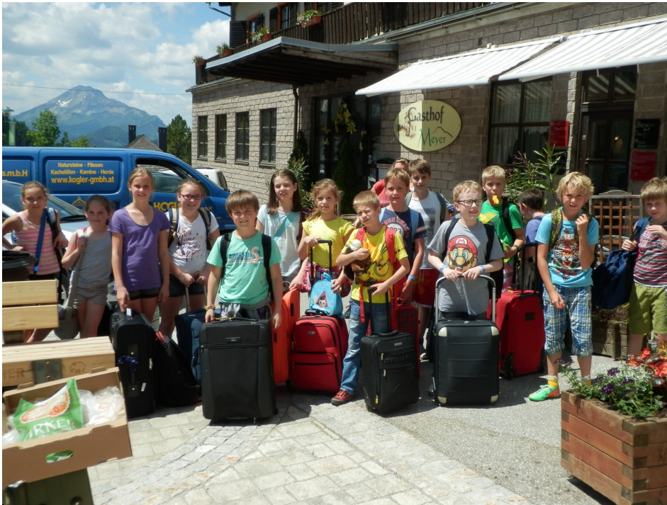
Untergebracht waren die Kinder im Gasthof und Appartementhaus Meyer.