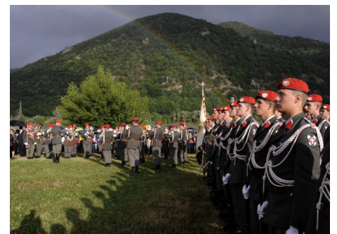
Nach einem kurzen Regenschauer - die Garde unterm Regenbogen.