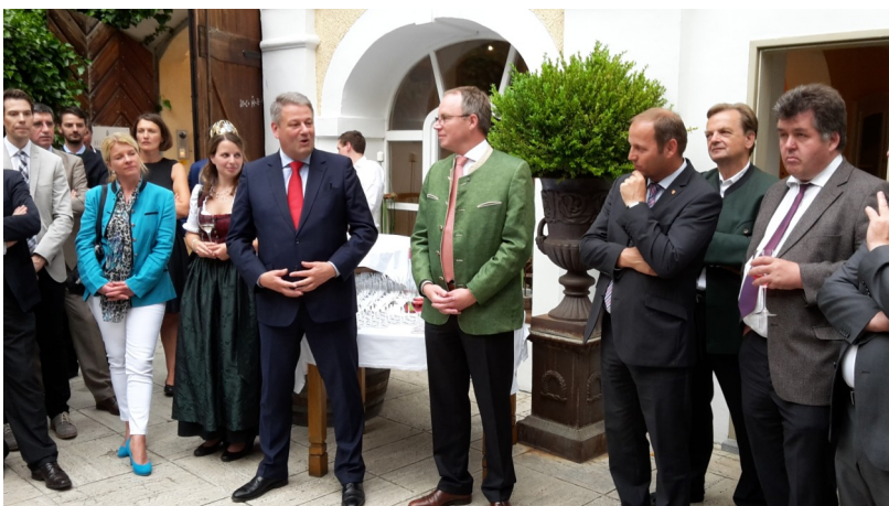
Treffen aller österreichischen Agrarlandesreferenten mit Bundesminister Andrä Rupprechter und Landesrat Pernkopf in Joching.