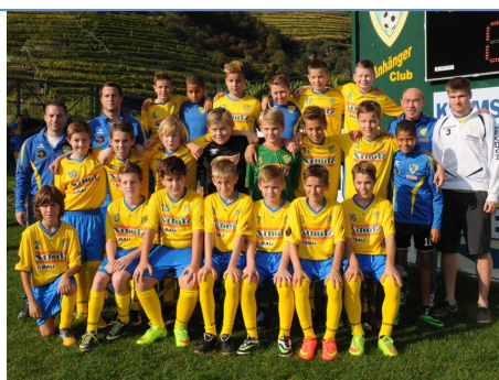
U13 mit Betreuersteam

Im Nachwuchsbereich konnte die U13 Spielgemeinschaft des SCW mit Spitz und Stein für Furore sorgen. Beim VW Junior Masters konnte sich die Mannschaft für das Bundesfinale qualifizieren und erreichte dort hinter Rapid, Austria, Ried, Kufstein und Admira den ausgezeichneten sechsten Rang. Im Frühjahr wurde das Team auch Meister im Oberen Play-Off der Jugendhauptgruppe Nord-west/Mitte und wird im Herbst 2015 als U14 in der