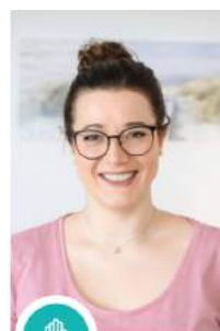
Iris Schwarz PHYSIOTHERAPIE u. PILATES